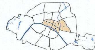
Carte de zonage des 1er, 2ème, 3ème, 4ème et 11ème arrondissements Echelle : 1/5 000ème

Périmètre des zones de carrières Périmètre des zones de gypse antéludien Plan de prévention des risques d'inondation révisé